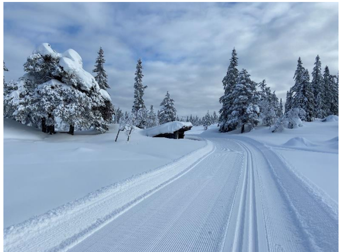
Ny-oppkjorte løyper ved gapahuken ved Nystøylvatn i februar